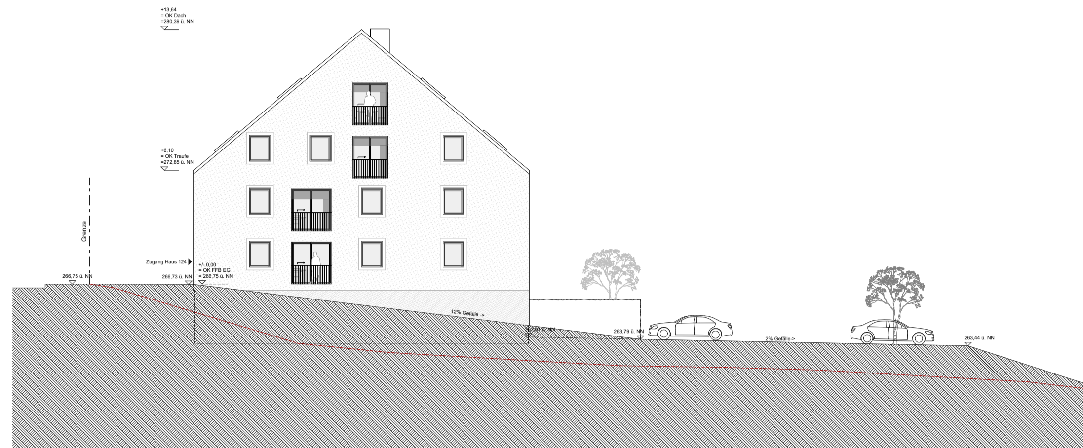
Ansicht West Haus 124