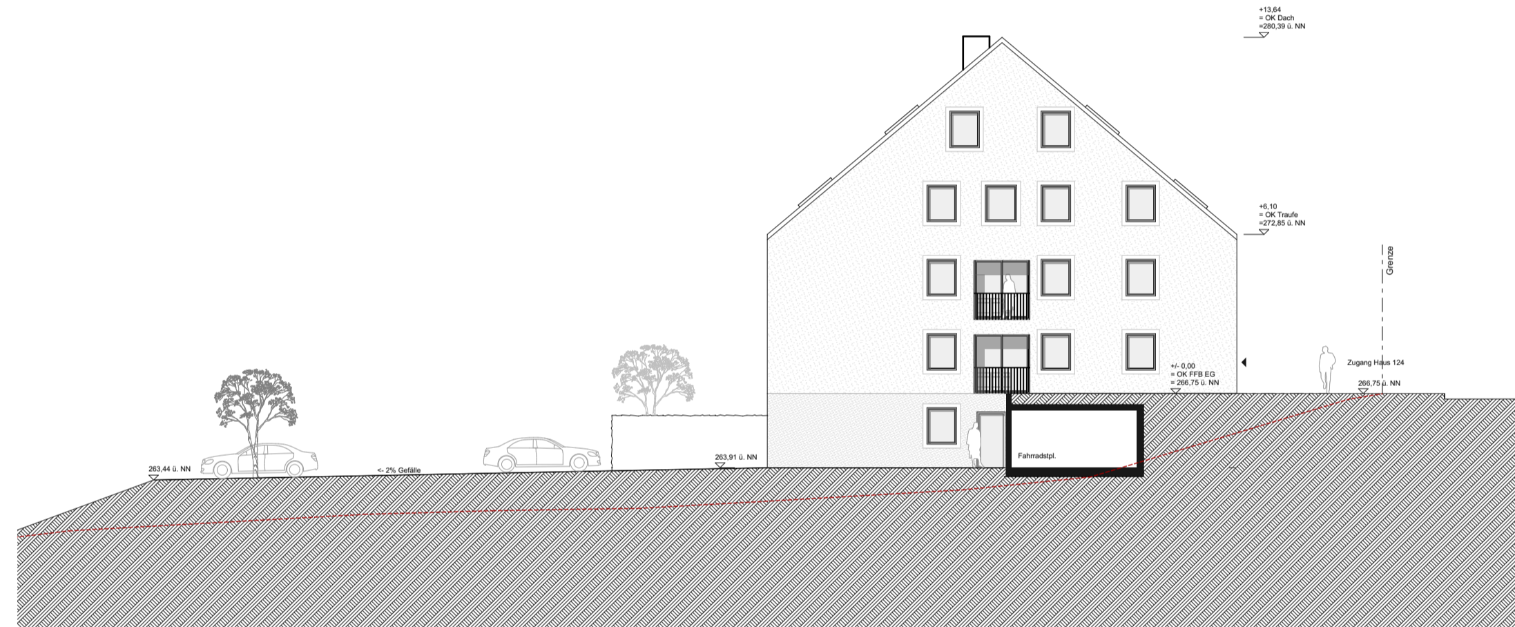
Ansicht Ost Haus 124