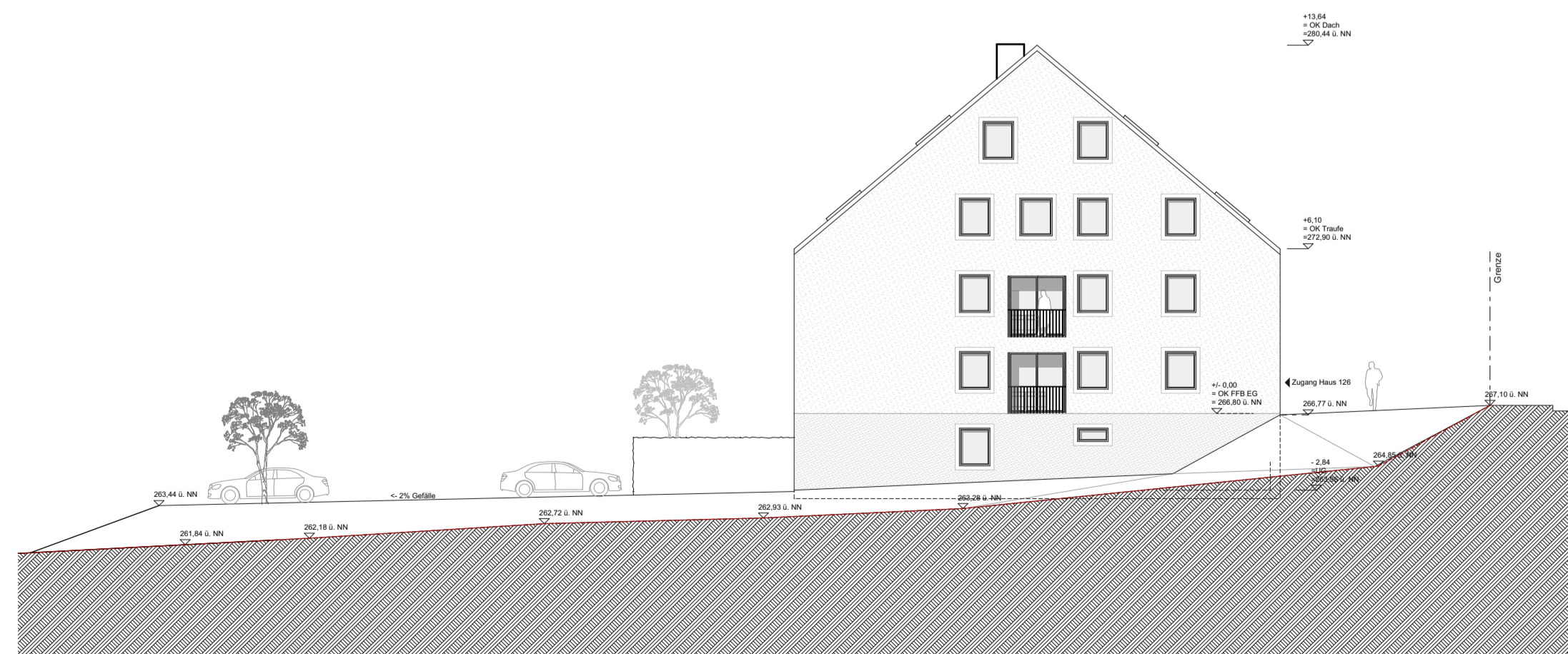
Ansicht Ost Haus 126