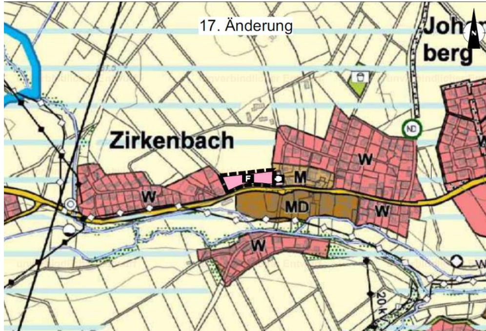
Abb. 2: Geltungsbereich 17. Änderung FNP

Das Änderungsgebiet hat eine Flächengröße von rd. 0,34 ha. Der Geltungsbereich umfasst das Flurstück 27/7, Flur 4 der Gemarkung Zirkenbach vollständig.