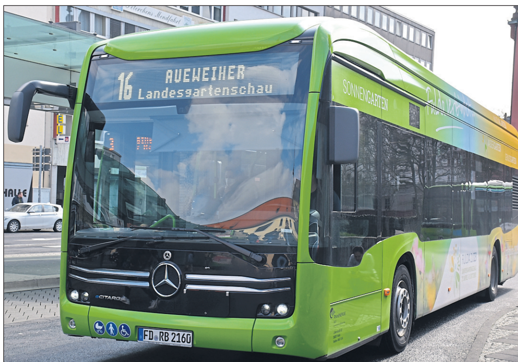
Ab Montag, 24. April, fährt die Linie 16 bis zum Aueweiher / Haupteingang der LGS.

Weitere Infos sowie die neuen Netzpläne gibt es in Kürze unter https://re-fd.de/nahverkehr