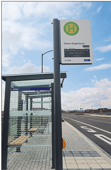
Die neue Haltestelle Überm Engelshaus befindet sich an der Sickelser Straße.

• Die Linie 4 (Oberrode/TP West – Stadtschloss – ZOB –