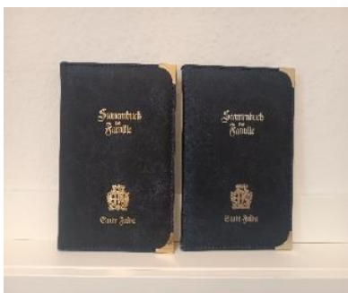
Wappen – Echtleder

- Die folgenden Fotos unserer Fulda-Stammbücher finden Sie zur besseren Ansicht nochmals auf unserer Homepage. -