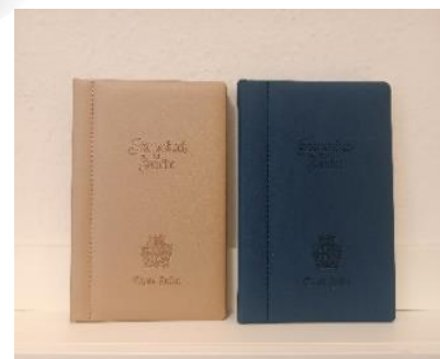
Wappen – Blindprägung