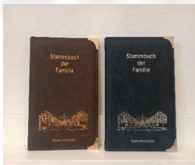
Stadtschloss – Echtleder