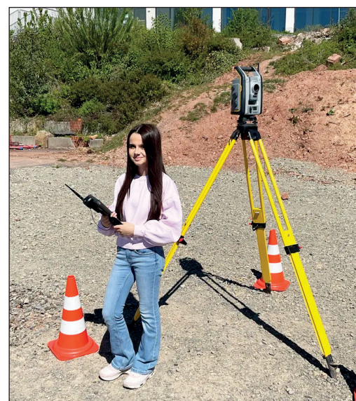
Auch in die Bereiche Stadtgärtnerei (links) und Vermessungswesen konnten die Schülerinnen und Schüler „hineinschnuppern“.