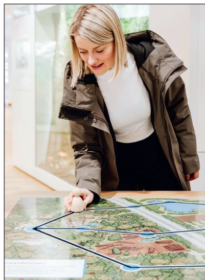
An der Audiostation gibt es Einblicke zum Thema Tierwanderungen.