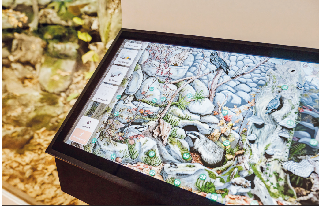
Die Medienstation bietet zahlreiche vertiefende Informationen zu den Tieren des großen Dioramas „Urwald auf der Blockhalde“ gleich nebenan.

Die digitale Medienstation lädt dazu ein, die Bewohner des Dioramas „Urwald auf Blockhalde“ kennenzulernen: Wildkatze, Kollkrabe & Co. geben Einblicke in ihren Lebensraum, ihre Lebensweise und die Herausforderungen, denen sie in der Natur begegnen. Ergänzend ist es möglich, an der Station sein Wissen