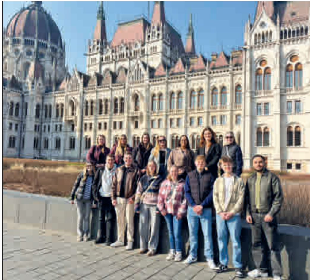
Die Gruppe der Stadt Fulda vor dem Parlamentsgebäude in Budapest.

Am Montagmorgen starteten die Auszubildenden und Studierenden mit dem Zug in Richtung Budapest. Bereits während der Fahrt arbeiteten sie an verschiedenen Arbeitsaufträgen, um sich mit den politischen Regierungsstrukturen Ungarns vertraut zu machen. Dabei standen Themen wie die Staatsform Ungarns, der Aufbau von Parlament und Regierung, die Rechtsstaatlichkeit sowie Ungarns Rolle in der Europäischen Union im Mittelpunkt.