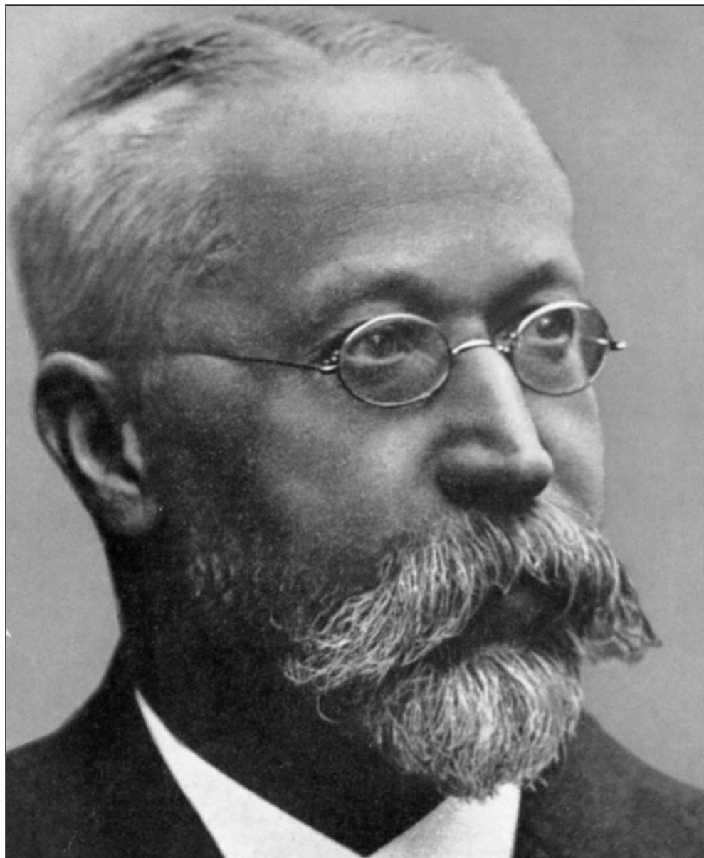
Der Fuldaer Ferdinand Braun erhielt vor 100 Jahren den Nobelpreis für Physik.