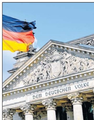
Kulturgeschichtliche Tagesfahrt nach Berlin.

Kulturgeschichtliche Tagesfahrten mit der städtischen VHS