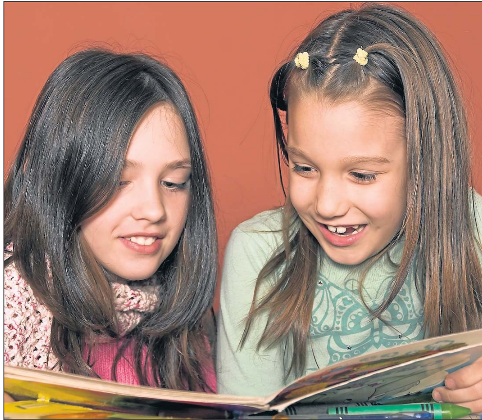
Die Reihe „Leseland“ will auch die Jüngsten für das Buch begeistern.