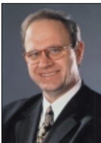
Ihr Wilhelm Dietzel Staatsminister für Umwelt, Landwirtschaft und Forsten

Für ein Gelingen der Durchführung wünsche ich viel Erfolg.