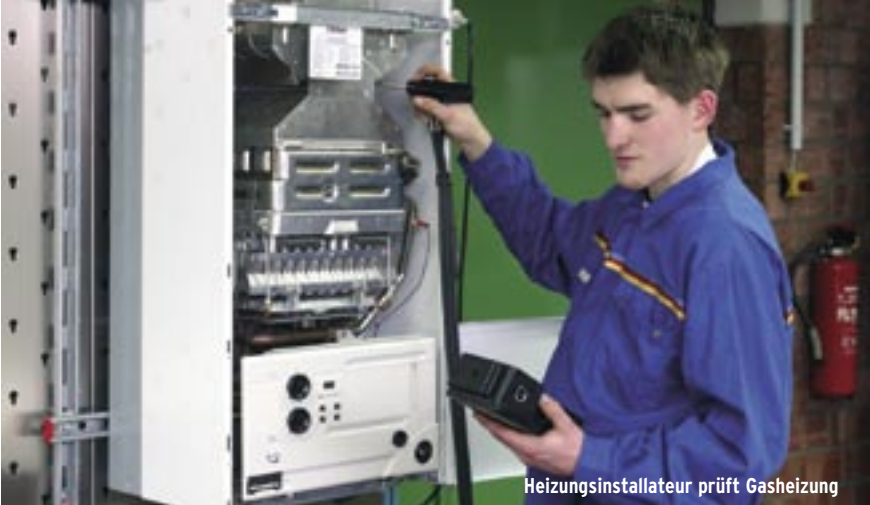
Heizungsinstallateur prüft Gasheizung

Ergebnis ist gleich: weniger Energieverbrauch. Die Energieeffizienz lässt sich in erster Linie durch effizientere Technik steigern. Doch effiziente Technik allein hilft nicht – alle können aktiv werden und Energie einsparen: Der Kühlschrank muss nicht größer sein als nötig oder mit arktischen Temperaturen laufen, und überheizte Räume sind oft sogar ungesünder.