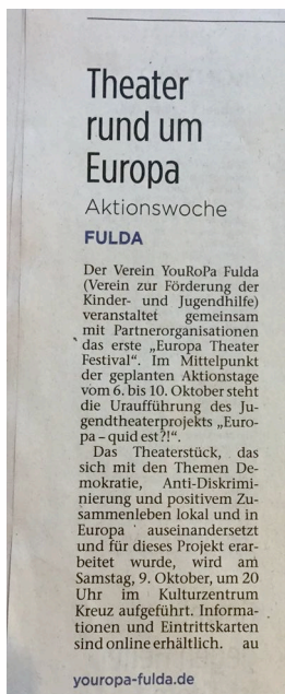
Fuldaer Zeitung: 04.10.21

Auch die weitere Presse in Fulda hatte über das „Europa Theater Festival“ berichtet: