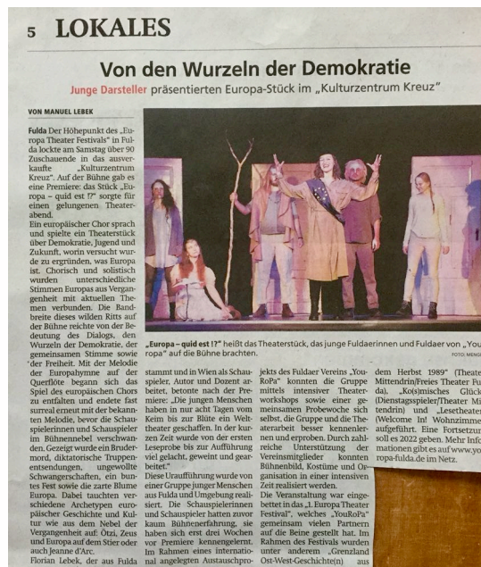
Fulda Aktuell: 16.10.21