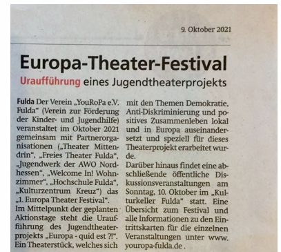
Fulda Aktuell: 09.10.21