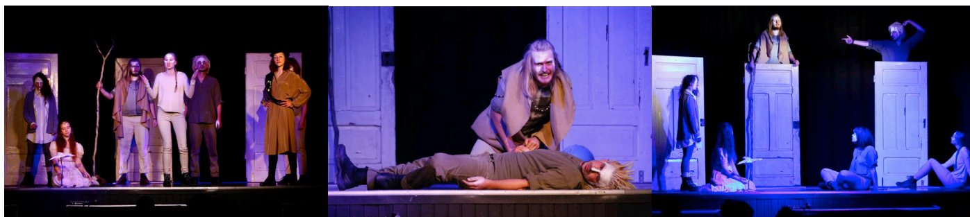
Fotos von der Premiere am 09.10.21