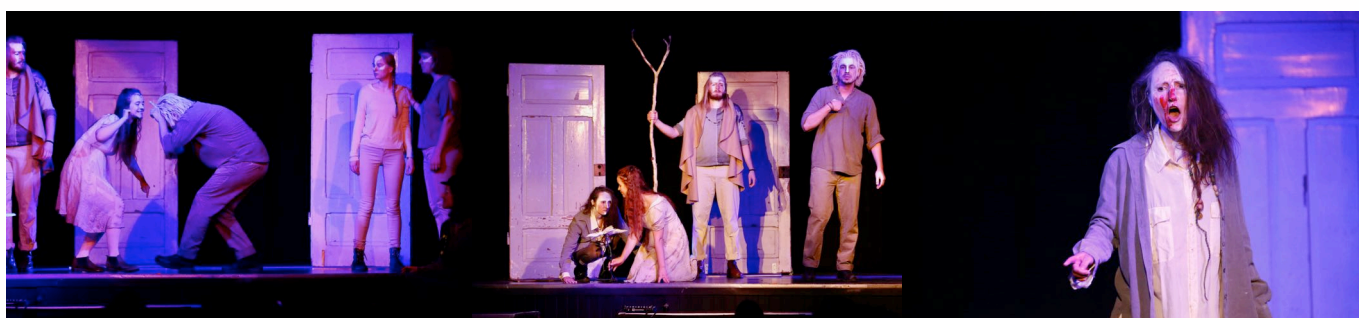
Fotos von der Premiere am 09.10.21

Der Höhepunkt des „Europa Theater Festivals“ in Fulda lockte am Samstag über 90 Zuschauende in das ausverkaufte Kreuz Kulturzentrum. Auf der Bühne gab es eine Premiere: das Stück „Europa - quid est !?“ sorgte für einen gelungenen Theaterabend.