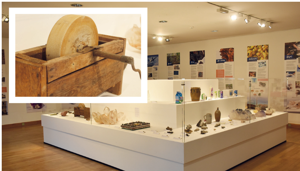
Die Ausstellung zeigt eine Fülle an Mineralien und Gesteinen sowie deren alltäglichen Gebrauch, zum Beispiel die Schleifmaschine aus Sandstein (kleines Foto).

Dabei sind Gesteine und Minerale überall präsent: Hei-