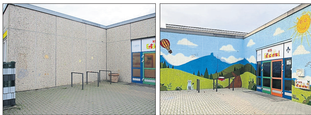
Statt einer grauen Betonwand schmückt den Eingang zu den beiden Kitas nun ein großes Gemälde, in dem Gestaltungsideen der Kinder aufgegriffen wurden. Fotos: Stadt Fulda

Alle Beteiligten hoffen, dass dieses kunterbunte Gemälde als eine langfristige Gestaltung bleibt. Finanziert wurde das Projekt über die Stadtteilarbeit. Der Dank der Projektverantwortlichen gilt dem guten Netzwerk im Stadtteil, das so sehr zu diesem Projekterfolg beigetragen hat.